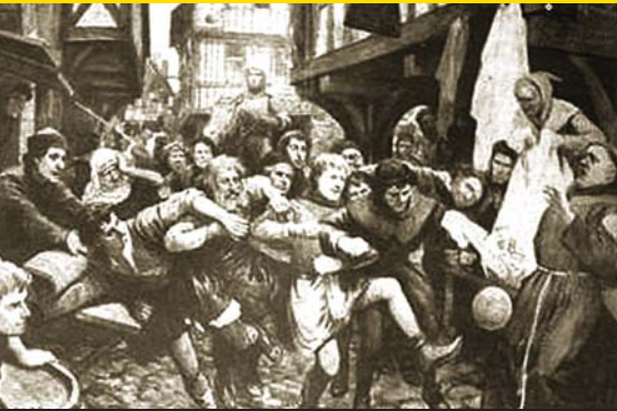
O futebol era mais um confronto violento do que um esporte.