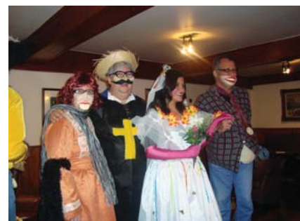
Casamento caipira - Figurino apropriado

A festa terminou com o casamento caipira