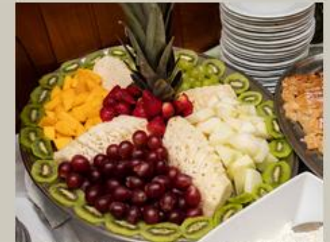
Tudo preparado com carinho pela nossa espetacular equipe