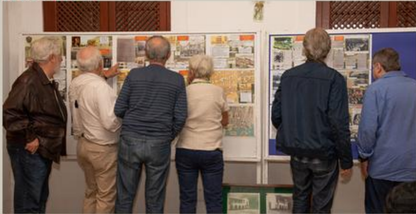
Espectacular pesquisa da Sociedade Germania feita por: Pierre Bauer, Harald Gübitz, Ludwig Zellner, e Margret Möller