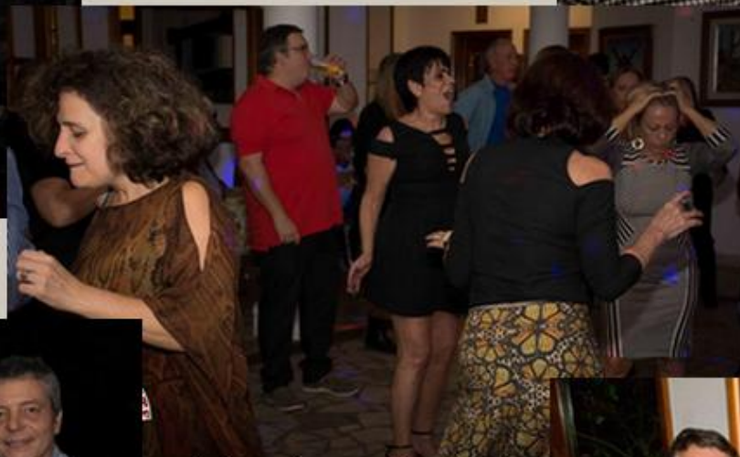
Animação e muita alegria.