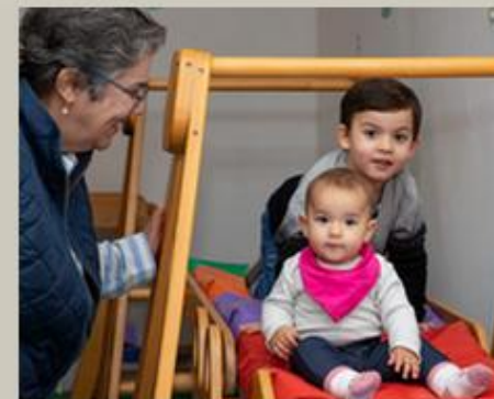
Os pequenos no parquinho