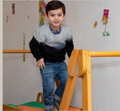
Novo parquinho interno, alegria da garotada