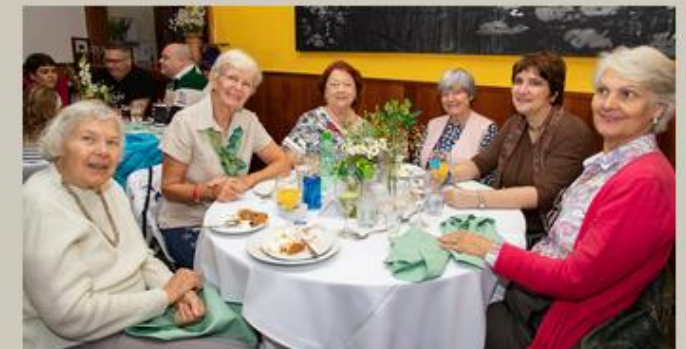
Senhoras da Schlaraffia