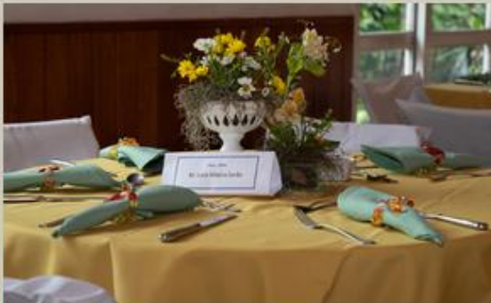
Decoração e produção: Elisa Lages