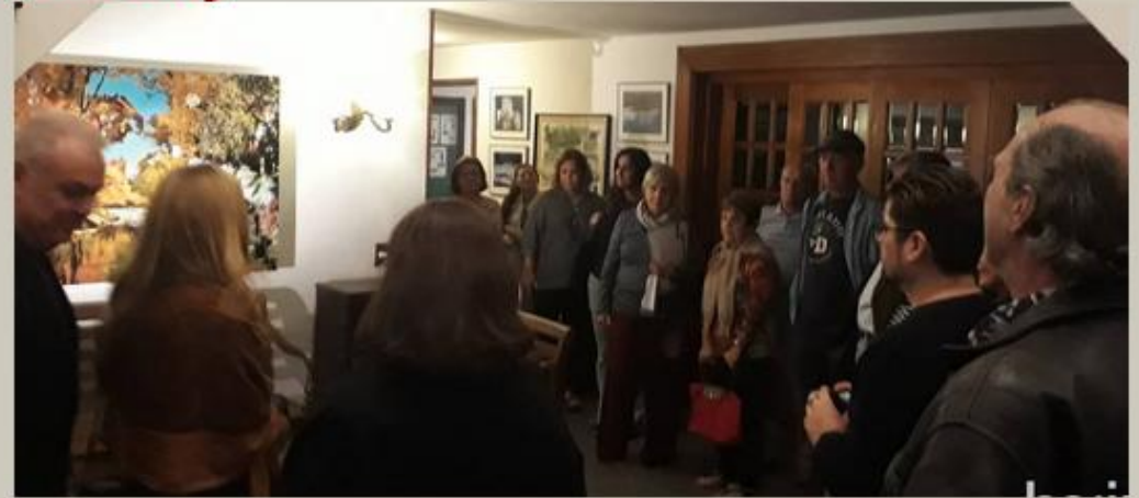
Após a excelente palestra, um passeio pelo Clube para mostrar as suas lindas obras expostas em nossos variados espaços.