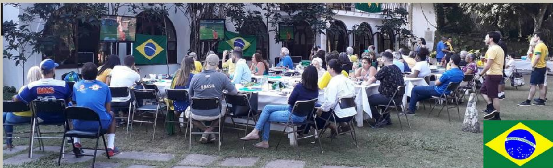
Muitos sócios e amigos da Germania assistindo aos jogos da Copa. A imprensa esteve presente registrando e filmando cada detalhe dos jogos da Alemanha.