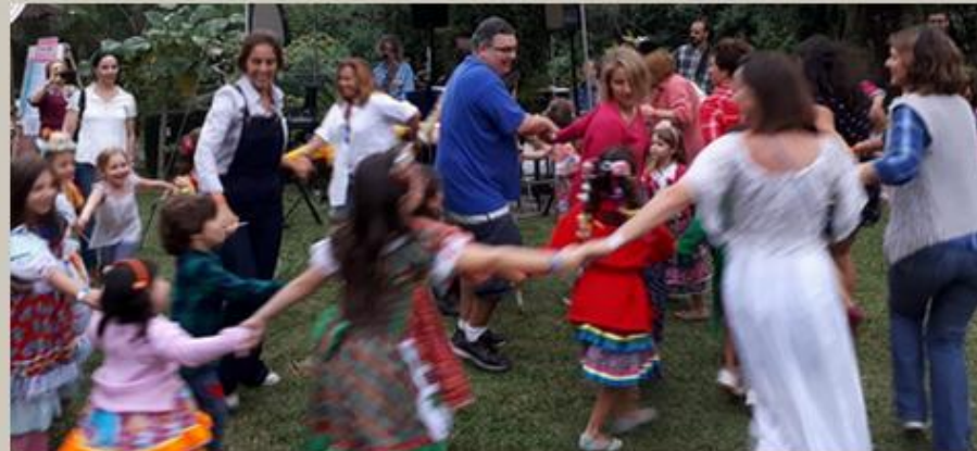
E as danças e cantorias das criancinhas e adultos. Que lindos!