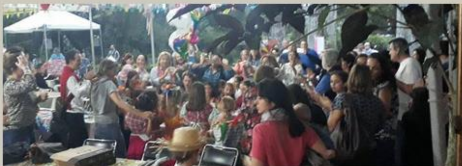
Agradecimento a todos que prestigiaram e colaboraram com o SUCESSO do nosso arraiá!