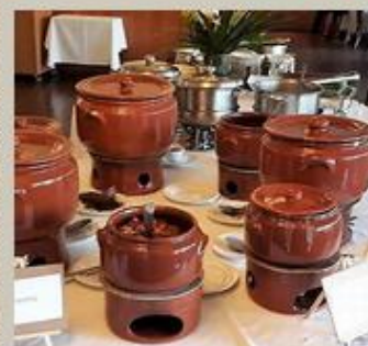
Buffet de Feijoada

Mais uma pequena parte das nossas opções: