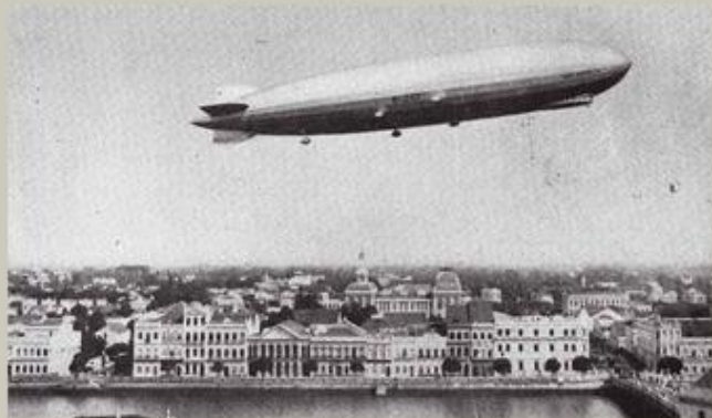
Graf Zeppelin, década de 1930 Recife, Pernambuco, Brasil Dieter Brodhun