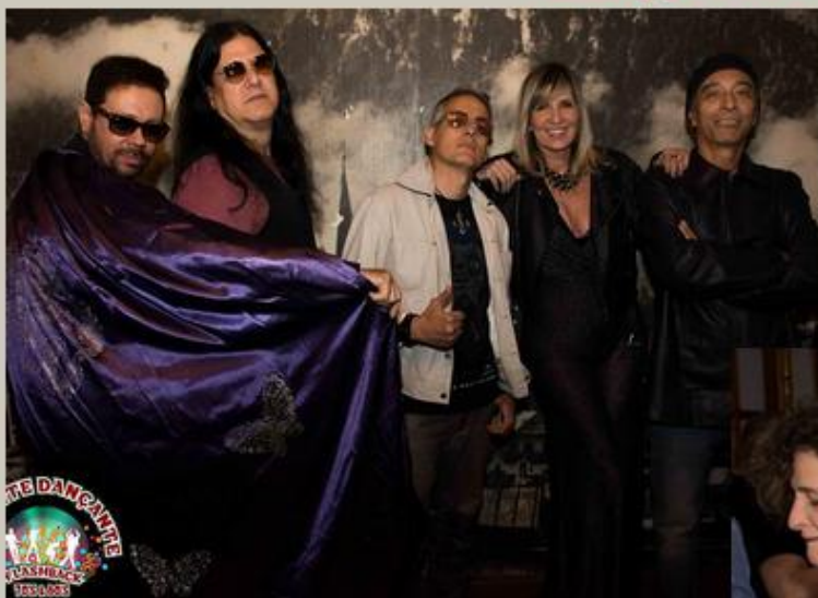
A banda Pop Story, fez todos dançarem e cantarem músicas inesquecíveis.