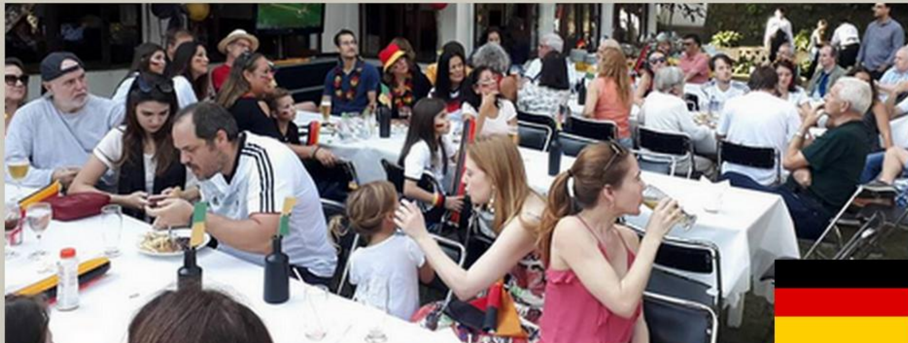
Biergarten com dose dupla de bebidas, pipoca e amendoim. Telão e DJ. Cada jogo uma emoção.