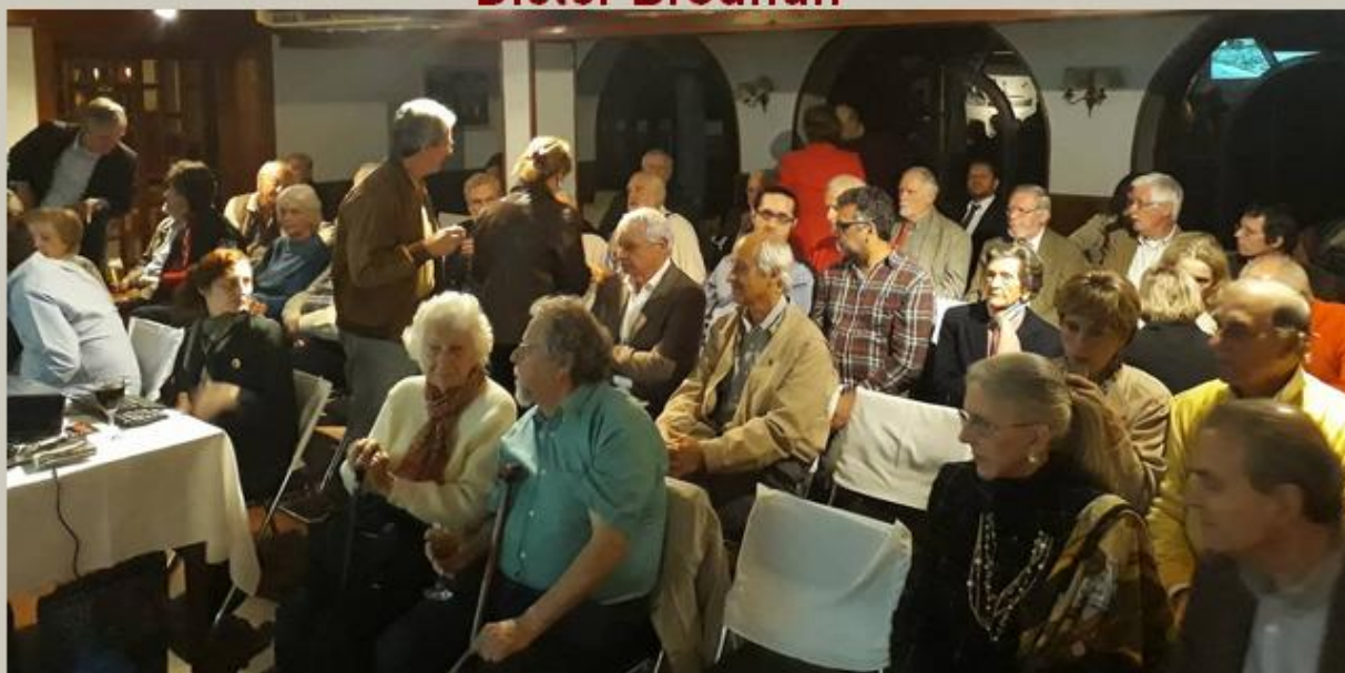
A palestra abordou aspectos curiosos, históricos e técnicos dos voos do dirigível Graf Zeppelin ao Brasil no período de 1930 a 1937.