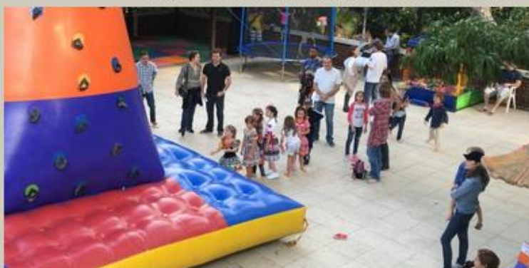
Brincadeiras e brinquedos para a criançada, que beleza!