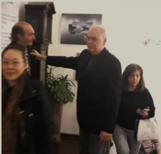
Explicando suas obras