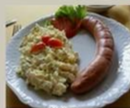
Salsichão com salada de batatas

Algumas opções da nossa gastronomia: Culinária Alemã