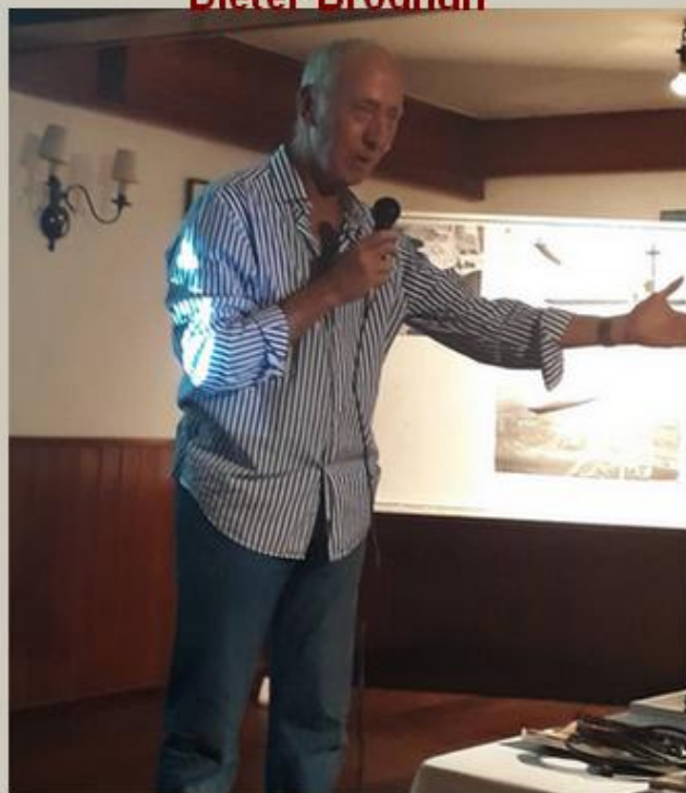
Ao longo de 35 anos, fez negócios em mais de 15 países e visitou mais de 50 em todos os continentes, coletando histórias e casos em cada um deles