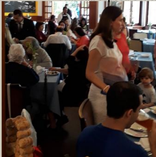
Confraternização e comemoração em uma deliciosa tarde