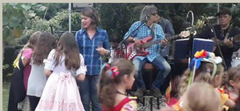
Música ao vivo com Grupo Mamulengo: oh gente, que animação arretada!