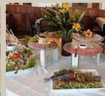
Buffet de Domingo

Maravilhoso!!! Carne / queijo e chocolate. De Terça a Sábado a partir das 18h.