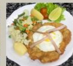
Escalope a la Holstein

Mais uma pequena parte das nossas opções: