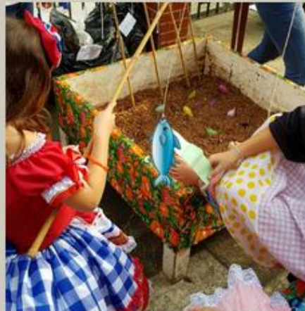
A criançada brincô a valer!!!