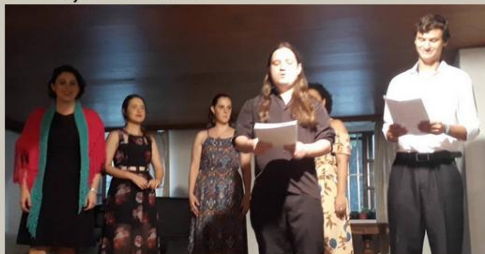
Tarde deliciosa de muita emoção e canção que fala ao coração.