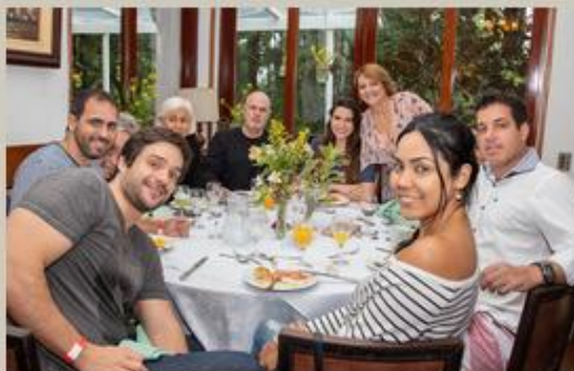
Família Lages e convidados