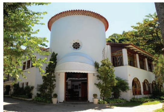
Sede atual da Gávea, rodeada de muito verde.

"A SOCIEDADE GERMANIA, fundada nesta cidade em 20 de agosto de 1821, é uma Sociedade Civil Brasileira, de intuítos não lucrativos, sendo seus objetivos difundir e desenvolver o espírito de cordialidade entre seus associados, bem como promover reuniões culturais, recreativas e sociais e fomentar o intercâmbio cultural e social brasileiro-alemão."