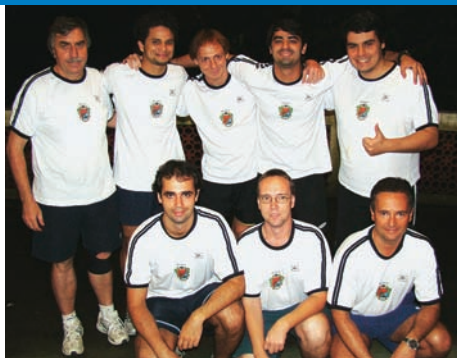
Time de Bolão (2009)

Feminino: 1) NFCC - 6 PG - 6279 pontos 2) SEF - 0 PG - 2554.