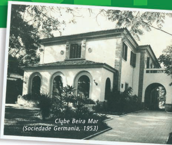
Clube Beira Mar (Sociedade Germania, 1953)

D izem-no, com muita propriedade, os franceses: "Si la vieillesse pouvait et si la jeunesse savait..."