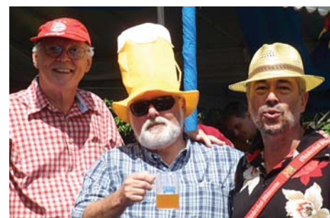
Oktoberfest Germania: os trajes são certamente bem mais descontraídos!

No Brasil, a Oktoberfest foi realizada pela primeira vez em 1978, no município de Itapiranga, extremo-oeste de Santa Catarina.