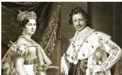
Therese e Ludwig I com trajes de gala. O casamento que imortalizou a Oktoberfest.

No ano seguinte, a decisão de repetir as corridas de cavalo deu origem à Oktoberfest.