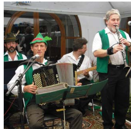
Músicos da “Rheiland Polka” animaram e tocaram músicas típicas

Ao final da festa a diretoria contabilizou a presença de um grande número de associados e