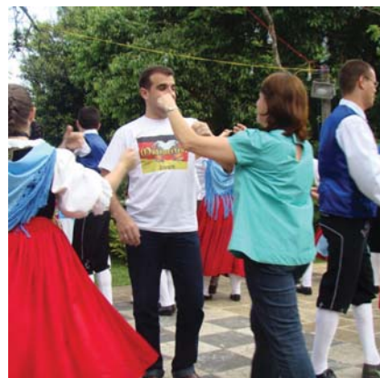
Ponto alto da Oktoberfest 2009 Blumenberg Volkstanz dança com o público

e seus colaboradores a postos. Barracas de chope; de Drinks; de Doces; Comidas e Refrigerantes. A barraca do churrasco foi muito procurada como também foi a do Restaurante “Landhaus” que fez muito sucesso com suas cervejas e especialidades