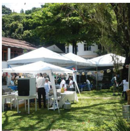
Vista do Jardim com os toldos cedidos pela Empresa Soleness

São Pedro, pelo tempo lindo permitindo uma