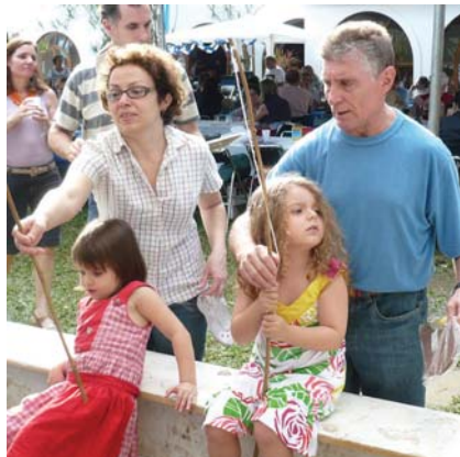
Mamães e papais preocupados com as peripécias dos seus pequenos

Aos poucos as barracas foram tomando forma