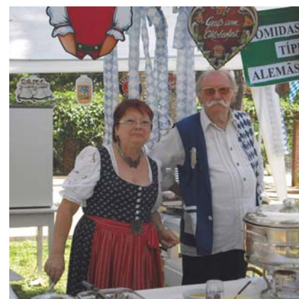
Barraca do Restaurante “Landhaus” e suas especialidades alemãs na Oktoberfest 2009

Berna S.P. (Brasaliment); Hanna e Santo Antonio Comércio de Laticínios; Salsicharia Klaus; Frutestory; Casa Engenho Soares; Casegi; Casa Nunes Martins; Shopfreezer e Companhia dos Sabores.