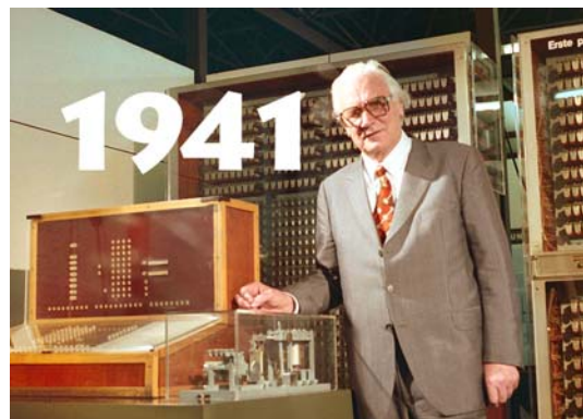
Konrad Zuse e o primeiro computador: o Z3

Foi a primeira máquina de calcular calçada no sistema binário (0 e 1), por isso é considerada antecessora do computador moderno.