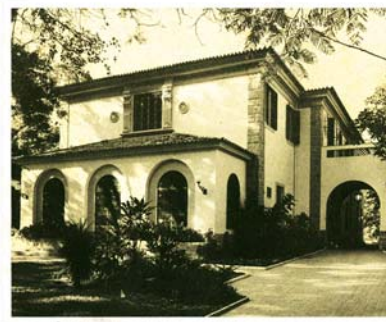
De esquerda à direita: Sede na Praia do Flamengo (1920). Sede no bairro de Botafogo (1953).