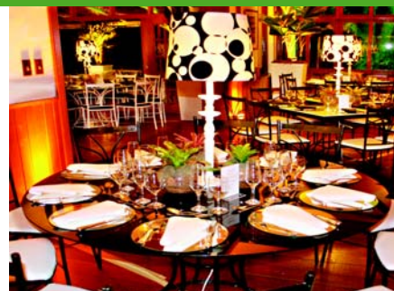
Amplios salões, muito verde e toda a infraestrutura da Germania para seu evento ser diferente e inesquecível!

Em breve enviaremos mais detalhes sobre reservas e preços. Até lá! Germania para você festejar a vida!