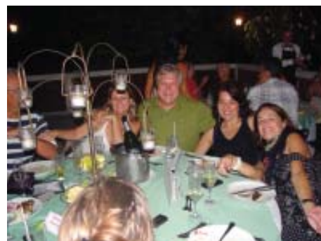
Associados e amigos ilustres - Alegria e descontração