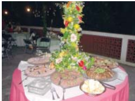
Festa tropical 2 e sua cascata decorativa

Os exemplos de eventos bem sucedidas no local se repetem mês após mês. O Salão Tropical aos poucos vai se transformando em uma excelente opção para quem quiser fazer a sua festa com uma temática mais exótica. Um amplo espaço rodeado de árvores de grande porte e um agradável cheiro de natureza, além de uma moderna churrasqueira. Desde já fica o convite: Dia 22 de março tem churrasco. Venha, traga a família e os amigos!