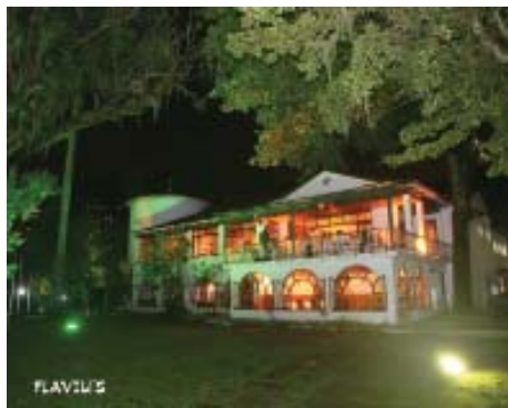
O prédio da sede durante a festa - Um ângulo diferente